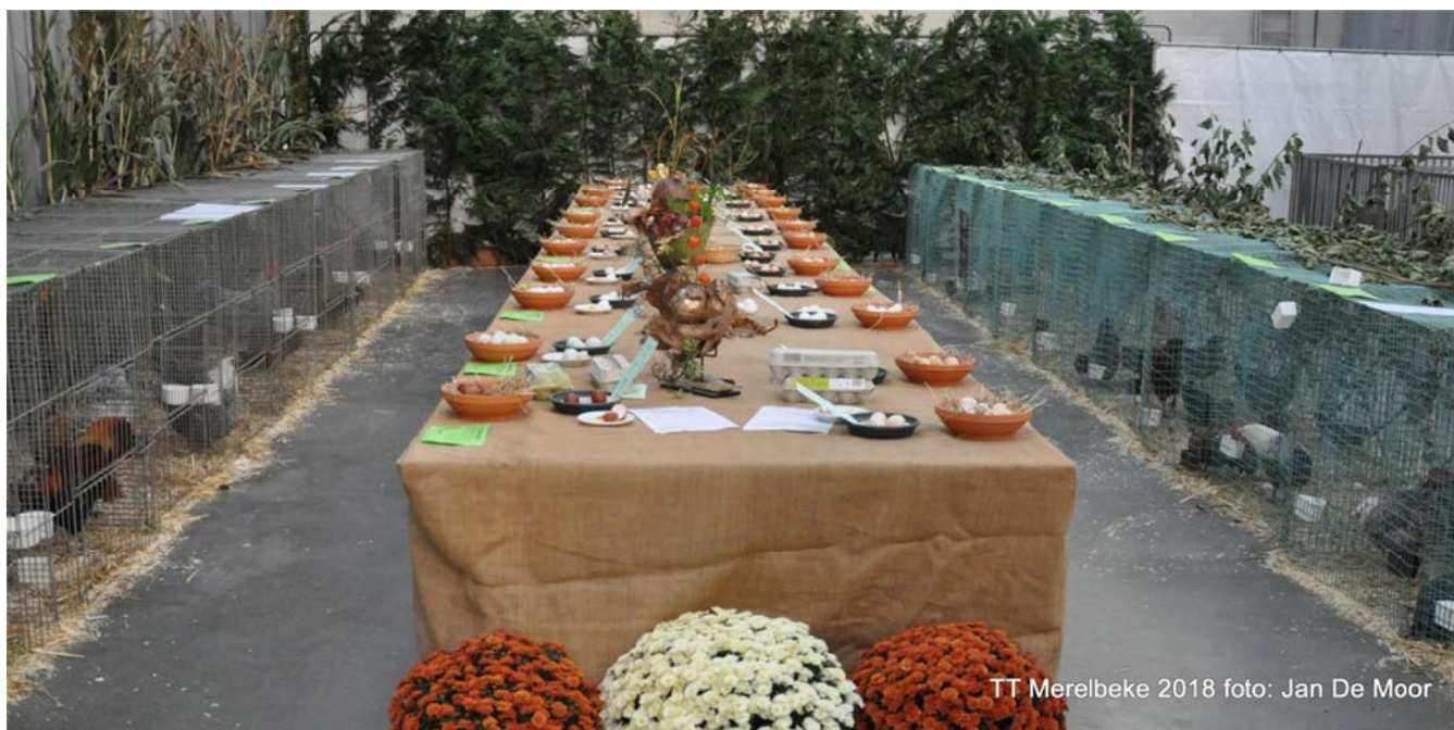
TT Merelbeke 2018

Indien de algemeen kampioen ook winnaar wordt van één of meerdere van de drie reeksen, vervalt deze prijs naar de tweede van die reeks behalve indien deze op zijn beurt winnaar is van één van de drie reeksen. Dan gaat die prijs van reekskampioen naar de derde in die reeks, enz. Het is in elk geval de bedoeling 4 verschillende fokkers te honoreren.